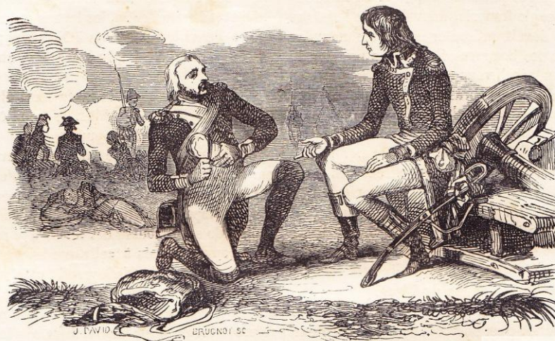
Napoléon, mourant de soif et de faim, partage le repas d'un soldat.

tel étaient placés des sièges pour les membres du Directoire, les ministres et le corps diplomatique; un vaste amphithéâtre était réservé aux autorités civiles et militaires. Une foule immense de spectateurs garnissait la cour et les fenêtres du palais, toutes les rues environnantes étaient remplies d'une multitude de citoyens, l'air retentissait de vivats. Des corps de troupes étaient disposés, tant à l'intérieur qu'à l'extérieur, pour le maintien de l'ordre.